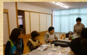
ボランティアさんを交えて

次年度よりトライアングルクラブの一層の充実を図り、子ども達と過ごしていただける活動が、楽しく♪ 為になる時間になるよう、考えていきたいと思ひます☆