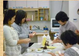
んっど...、こうかなあ??