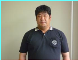
P T A 会長