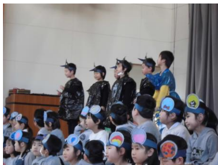
1年「おむすびころん」