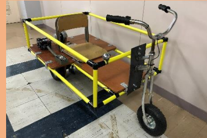
電動ゴーカート (平成30年度卒業生作品)