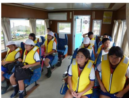
わじまっ子海の体験活動(湾内見学でした)

少し困難な事にも挑戦して、自分を成長させる事のできる充実した学期にしたいものです。