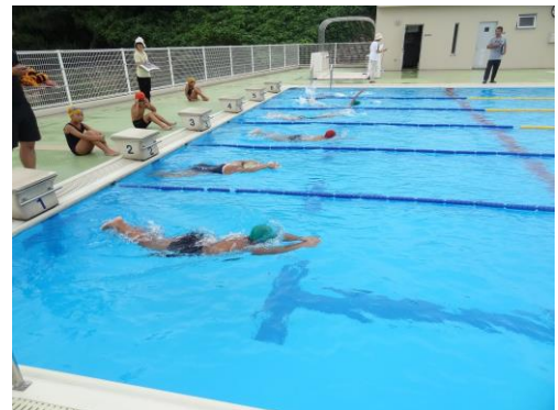
校内水泳記録会 力泳！

保護者の皆様には、この夏休み中、プール監視や地域行事参加へのご理解などお世話になりました。さらに8月29日（土）には、公民館の皆様と共に草刈り作業で運動場周辺がすっかりきれいになり、児童が気持ちよく活動できる環境を整備していただきましたことに感謝申し上げます。