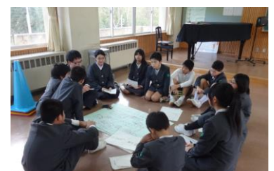
5・6年生 児童総会反省会