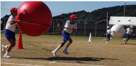
「白熱！ 大玉運び、勝敗の行方は？」

地域と合同の社会体育大会(西小運動会)が9月10日に開催されました。9月の声を聞くとすぐ練習に取りかかり、児童の赤組白組の所属意識が高まるとともに、集中力も高まって、10日には一番実力を発揮することができたのではないかと思います。