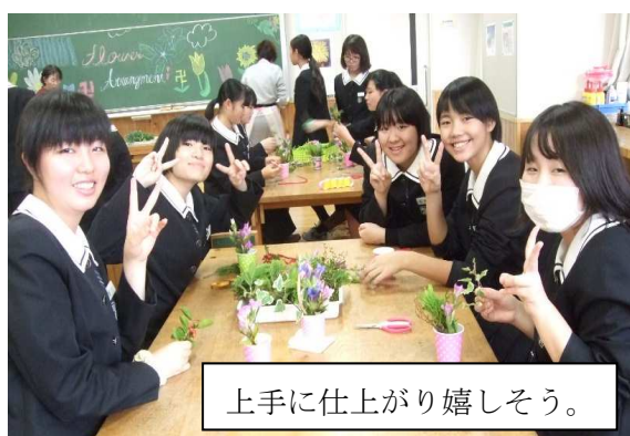
上手に仕上がり嬉しそう。