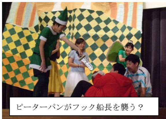
ピーターパンがフック船長を襲う？