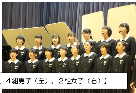
【指揮者を見つめ、心を一つにして歌う、4組男子(左)、2組女子(右)】