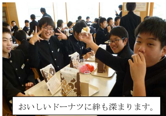
おいしいドーナツに絆も深まります。