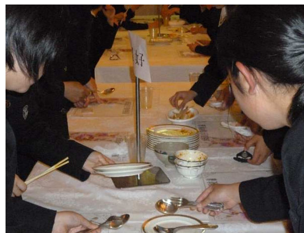
食事の後片づけのすばらしさ!