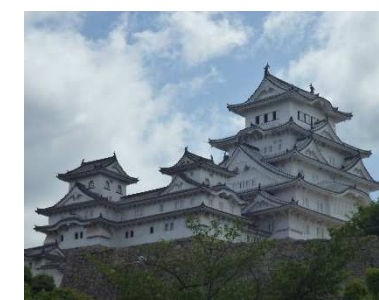
クラス別研修・見どころ満載!