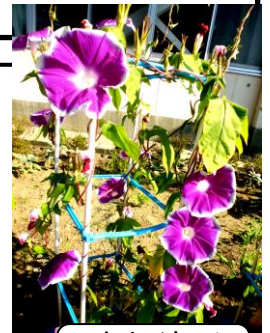
1年生が育てたアサガオ