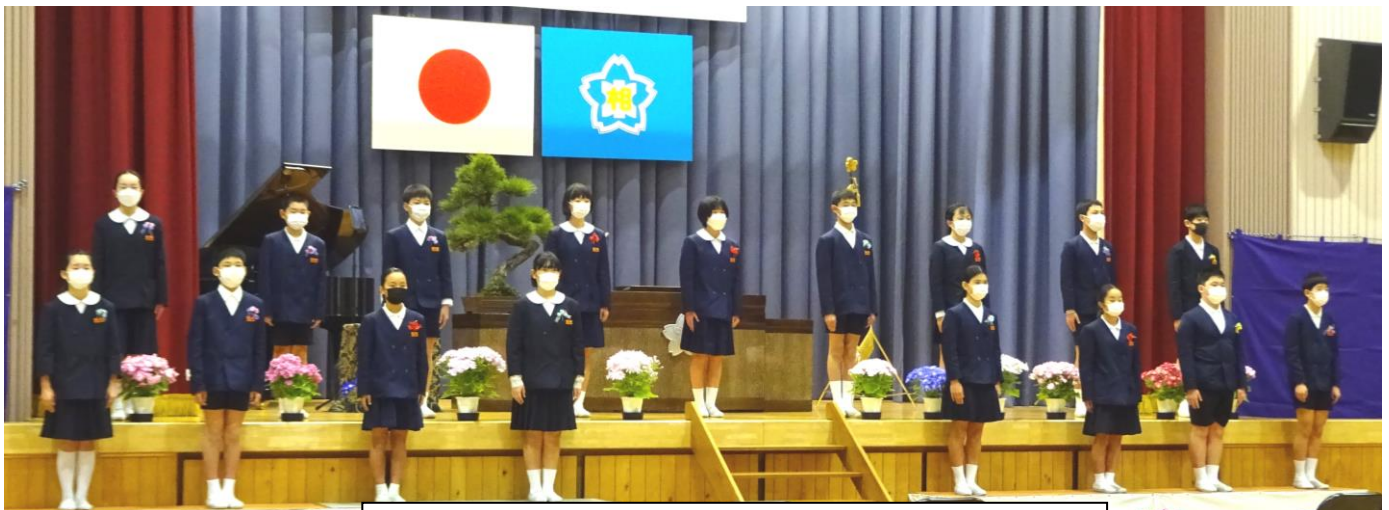
凛々しい卒業生17名 ありがとう さようなら

そして、在校生代表として式に参加した5年生20名。素晴らしい姿でした。準備から後始末まで、来年、最高学年になる自覚と受け継ぐ覚悟をひしひしと感じました。今後の活躍が楽しみです。