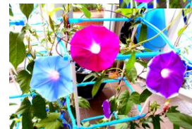
1年生が育てたアサガオ

状況によって、プール開放が 中止となる場合は、保護者メー ルで、 10時30分までに連絡 します。確認をお願いします。