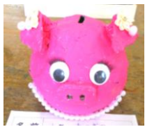
【ブタさんちょきんばこ】