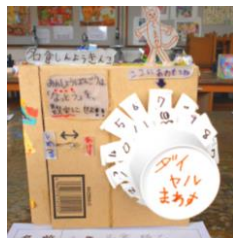
【名倉しんようきんこ】