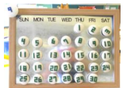
【クロスステッチカレンダー】