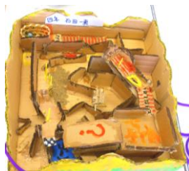
【アスレチック迷路】