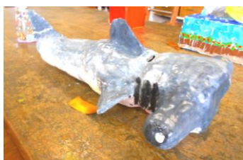
【シュモクザメのちょきんばこ】