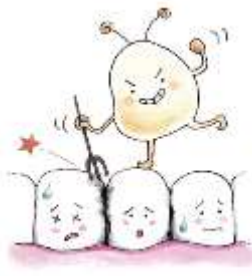
はは あいだ 歯と歯の間