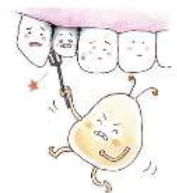
はなら 歯並びがでこぼこしている場所