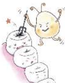
おくぼ 奥歯のみぞ