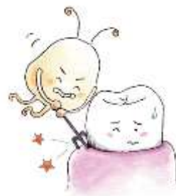
はは さかいめ 歯と歯ぐきの境目