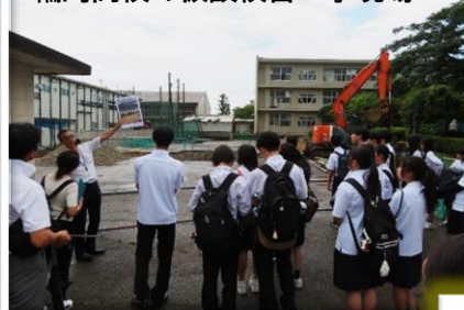
輪島高校の仮設校舎工事現場