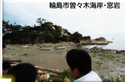
輪島市曾々木海岸・窓岩