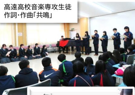
高遠高校音楽専攻生徒 作詞・作曲「共鳴」