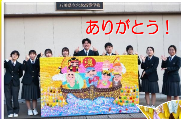
折り鶴を丁寧に張り付けて「七福神」を表現した折り鶴アートです