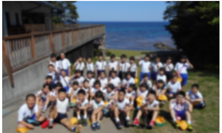
3・4年生 能登町 海洋ふれあいセンター