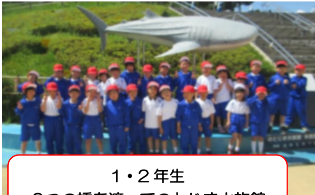
1・2年生 2つの橋を渡ってのとしま水族館