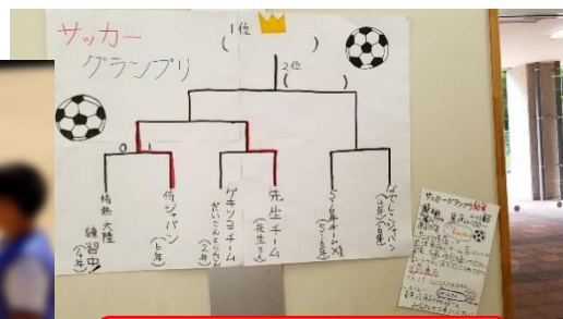
サッカーグランプリ