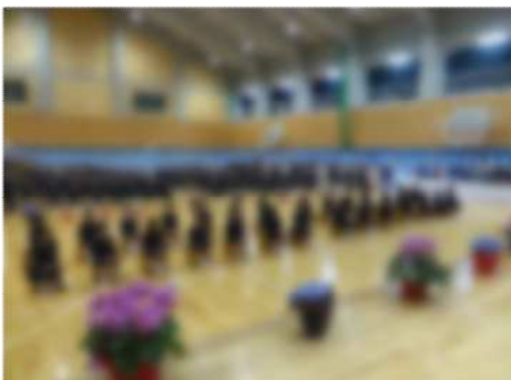
新しい学校の様子

この目標は、私が初めて校長になったときから続けている目標です。前任校の徳田小学校でもこの目標で取り組んできたのですが、正直言ってまだまだと思っているうちに閉校となってしまいました。やり残したことは山ほどあります。少しでもこの目標に近づけるように職員一同一枚岩となって取り組んでいきます。