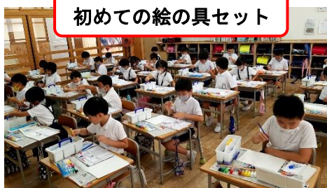
初めての絵の具セット

少しずつ、お兄さんお姉さんらしくなってきた2年生。音楽の時間に体を使ってリズム遊びをしたり、初めての絵の具セットで楽しく学習しています。