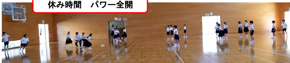
休み時間 パワー全開