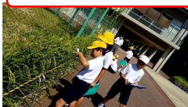
総合 バケツ稲の観察とインターネットで調べ学習

3密に配慮し、家庭科で大きく2グループに分け、ゆでたまごの実習をしました。家でも試してみた人がいるのではないのでしょうか。総合学習ではバケツ稲を観察したり、インターネットで調べたりしています。