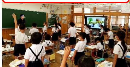
3年生からの社会の授業