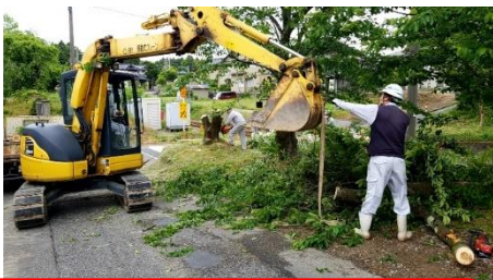
歩道確保のため、桜の木伐採