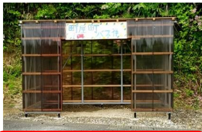
これで安心、町屋バス停待合室