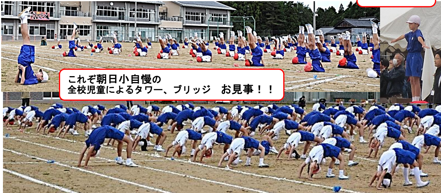
これぞ朝日小自慢の 全校児童によるタワー、ブリッジ お見事！！