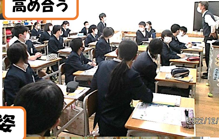
充実した学びの姿