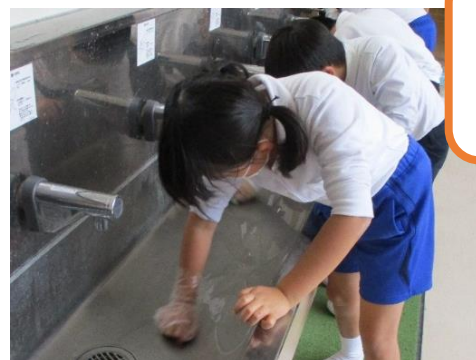
心も 校舎も ピカピカ