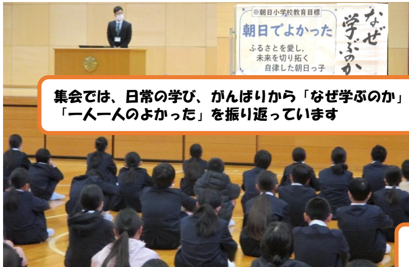
集会では、日常の学び、がんばりから「なぜ学ぶのか」「一人一人のよかった」を振り返っています