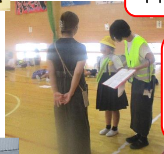
全校： 引き渡し訓練 ご協力 ありがとう ございました