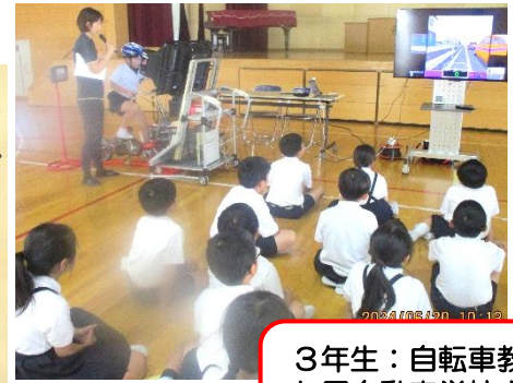
3年生：自転車教室 七尾自動車学校さん PTA 校外安全部