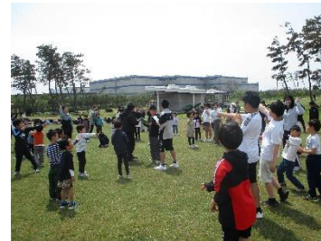
【2学年での春の遠足】