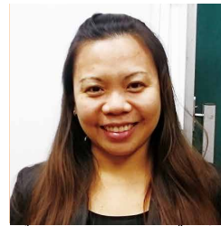
だいにほんじん ざいこうせい 30代・フィリピン出身(在校生)

ひるまかいごのしごとをしていますので、やかんちゅうがくでべんきょうしています。ゆめをもっているかた、レベルアップしてスポーツとべんきょうができます。ねんれいはかんけいありません。あんしんしてべんきょうをたのしめるので、ぜひみなさんいきましよう。