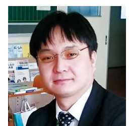
だいにほんじん そつぎょうせい 30代・日本人(卒業生)

あきらめずに前に進んでほしい。私の初めての学校は「夜間中学」でした。全てが新鮮、毎日が発見の日々。一生は一度つきり。学べる時間も多くはありません。夜間中学に通って、学校を好きになってみて下さい。