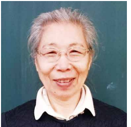
だいちょうせんはんとうしゅうしん ざいこうせい 70代・朝鮮半島出身(在校生)

わたし せんそう ため がっこう まなぶ 私は戦争の為に学校で学ぶことができませんでした。勉強は若いうちにするべきです。今勉強ができるかんきょうの方々、こうかいのないようにまなんで下さい。