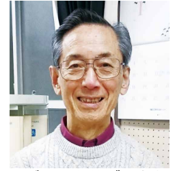
だいにほんじん ざいこうせい 80代・日本人(在校生)

これから入学しようかどうか迷っているのでしたら、迷わずすぐに入学する事をすすめます。いろいろな国から来ている人たちがばかりですからとにかく楽しいですよ、人生年をとってもいつも青春。