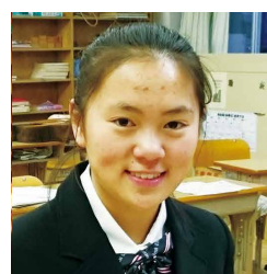
だいにほんじん ざいこうせい 10代・日本人(在校生)

わたし やかんちゅうがくでのせいかつ じゅうじつ せいかつ じゅうじつ 私の夜間中学での生活は充実していると思います。もし勉強してみたい人がいたら、是非夜間中学へ来て下さい。