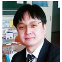
30多岁、日本人 (已毕业生)

希望不要放弃，一直向前进。我的第一所学校就是“夜校初级中学”。一切都很新鲜，每天都有新的发现。人生只有一次。可以学习的时间并不多。请上夜校初级中学，并爱上她！