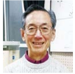
80多岁、日本人 (在校生)

如果你对今后要不要上夜校初级中学犹豫不决，我建议你毫不犹豫地立即去上。都是来自各种国家的学生，学习很愉快，人生何时不青春。