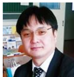
30多歲、日本人(已畢業生)

希望不要放棄，一直向前進。我的第一所學校就是「夜校初級中學」。一切都很新鮮，每天都有新的發現。人生只有一次。可以學習的時間並不多。請上夜校初級中學，並愛上她！