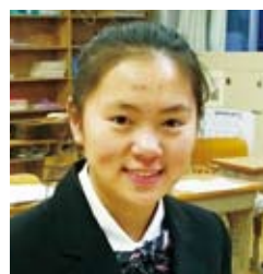
10多歲、日本人(在校生)