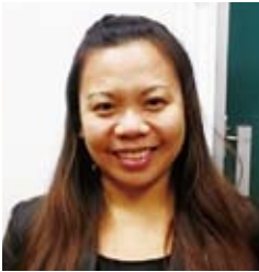
30대·필리핀 출신 (재학생)

낮에 복지간호 일을 하는 관계로 야간 중학교에 다니고 있습니다. 나이에 상관없이 공부하는 물론 스포츠도 안심하고 즐길 수 있으니 여러분도 망설이지 말고 입학해 보세요.