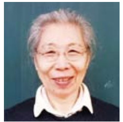
70대·한반도 출신 (재학생)

저는 전쟁으로 인해 학교에서 공부하지 못 했습니다. 공부는 젊을 때 해야 합니다. 지금 공부할 수 있는 환경에 있는 분들은 후회되지 않는 길을 선택하기 바랍니다.