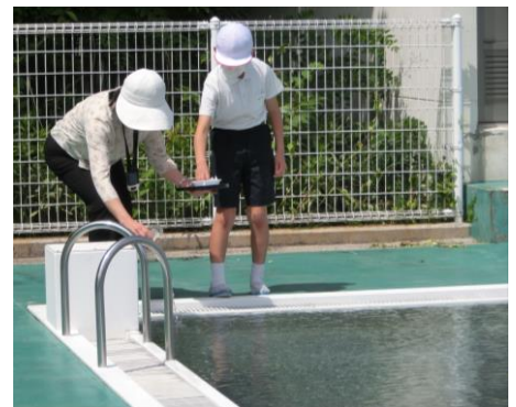
【水の神様にお祈願しました！】

全校児童がプールの周りに集まり、プール開きをしました。暑い夏に冷たいプールでお友達と泳いだり遊んだりするのはとっても楽しいことです。でもちょっと油断すると、泳げる人でも大きな事故につながり、時にはおぼれたり、心臓まひを起こしてしまったりすることもあります。そのようなことがないように、美化体育委員長さんと一緒にプールの「水の神様」にお酒やお塩をおそなえて「どうぞ事故がありませんように。みんなが楽しく泳げますように。」とお祈願しました。これから8月初旬までの2ヶ月ぐらいの間、大ケガや溺れるような事故がないように、「プールでのきまり」についてのお話もありました。水泳は心と体が鍛えられるとても良いスポーツです。はじめはなかなか泳げなかった人も、頑張っって練習すると、終わりの方には泳ぐことができるようになります。そして、泳ぐ距離やタイムをどんどん伸ばしていくことができます。今年も自分で目標を立て、その目標が達成できるよう、みんなで頑張りましょう。