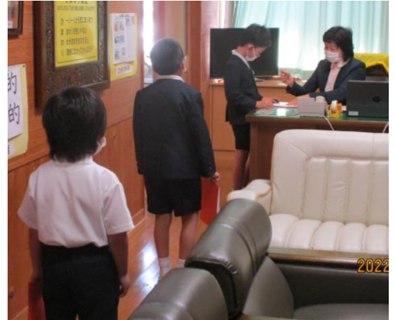
【3年生の暗唱10級！「六あき九九」】