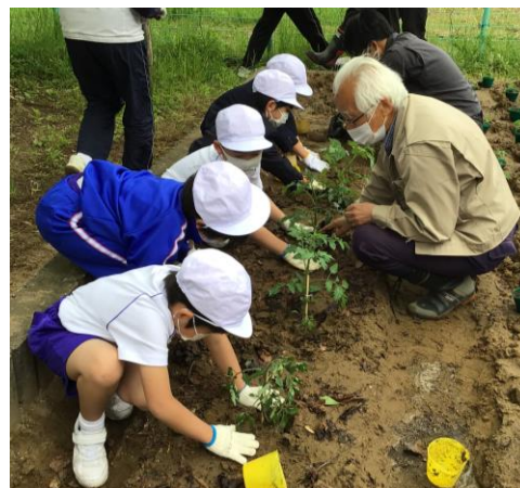
【1年生：苗の植え方を教わり植えています！】

方を教わった後、1人4～5本の苗を植えました。能登金時の苗の葉を東に向け、3節が土に埋まるように横に寝かせて植えました。植えた後に、たっぷり水を上げました。収穫の喜びを味わうために今年も水やりや草取りをしっかりと行い、秋には感謝祭をする予定です。その際には、老人会の方々もご招待しておもてなしをしたいと思います。