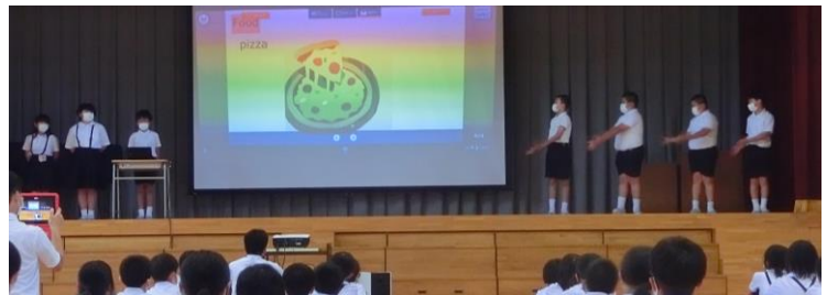
【5年生の③の様子：What [food] do you like?】

羽咋市では、英語教育の推進を重点に置いています。この取組の背景と現在学校で取り組んでいることをご紹介します。