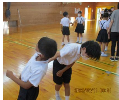
【手を捕まれた時の外し方の練習】

学校に不審者が侵入したという想定で、避難訓練を行いました。児童は、外を通り体育館へ避難し、先生方は児童の避難誘導をする人と、不審者に対応し児童の方へ近づかないようにする人にと役割分担をして練習しました。全員が避難し、不審者を確保した後、全校児童で「手をつかまれた時の振りほどき方」などを練習しました。不審者に声をかけられた時の合言葉は「 い か な い の ら な い お お き な 声 を だ す す ぐ に げ る し ら せ る」です。不審者について