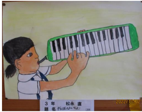
【三年生の「鍵盤ハーモニカを弾く自分」】