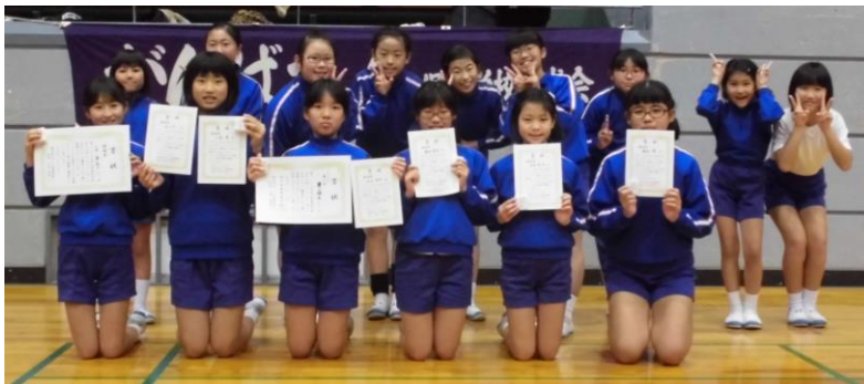
【熱戦を繰り広げた選手たち】

11月24日(日)に羽咋体育館でソフトバレーボール大会が行われました。どのチームもよく健闘しました。6年生は、3位でした。おめでとうございます。3週間前の練習を始めた時に比べるとずいぶん上手になりました。