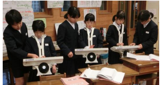
【鼓笛の引継ぎ：6年生が教えてくれました】

さて、子どもたちにとって楽しい冬休みが始まります。クリスマス・年末・年始と楽しいことがたくさんある2週間です。夜更かしをする機会が増え、規則正しい生活を送ることが難しい日があるかもしれません。しかし、大切な子ども