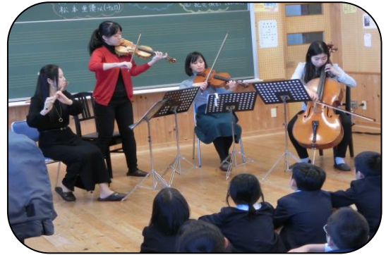
【プロの素晴らしい演奏に感動！】