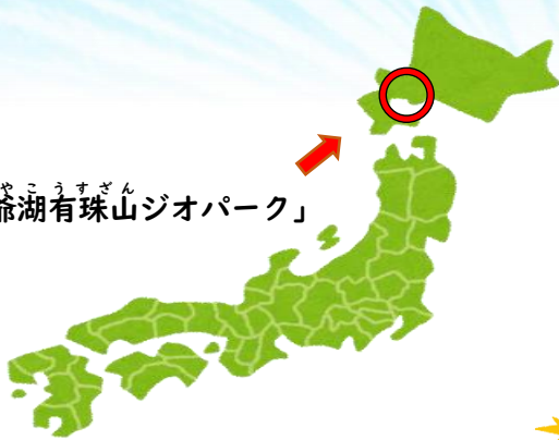
とうやこうすざん 「洞爺湖有珠山ジオパーク」

せかい かがくてき きちょう ちけい ちしつ 世界ジオパークとは、科学的に貴重な地形や地質 も ちいき にんてい せかいてき を持つ地域をユネスコが認定するものです。世界的 に認められた素晴らしい国や地域の食文化を、 すば くに ちいき しょくぶんか 給食で味わいましょう。