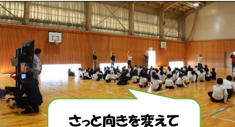
さっと向きを変えて 興味津々

人の価値観や考え方の話をしました。少し難しいのですが、「<できるには時間がかかる><失敗から学ぶ><やってもムリ><ちょちょいのちょいで終わらせる>など、人は両方持っているけれど考え方を変わると成長につながるよ」ということです。集会はいつも先生方も参加します。子どもたちは、先生の反応を見るのが大好きです。