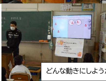
どんな動きにしようかな？