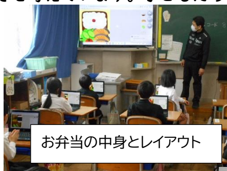
お弁当の中身とレイアウト