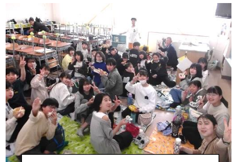
6年教室 みんなでお弁当

遠足は5月1日(水)になります。保護者の皆様には、お弁当など遠足に関わる準備のご協力、ありがとうございます。