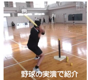
野球の実演で紹介

4月18日6年生が各グループで考えたクラブに4、5年生を募集する集会がありました。6年生は自分たちのクラブに入ってもらおうと、思考を凝らした魅力的な発表をしていました。