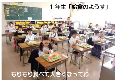
もりもり食べて大きくなってね

26日(金)は、ご多用の中、授業参観・学級懇談会にお越し頂き、誠にありがとうございました。子どもたちはいつも以上に張り切って授業に参加していたのではないかと思います。