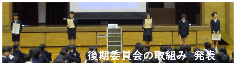
後期委員会の取り組み 発表