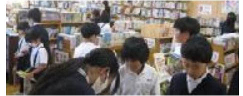
読書週間(図書委員会)の取り組み (スタンプラリーと宝くじ)で

12月は1年のしめくり、2学期のまとめの月です。自分の生活や学習をふり振り返り、できるようになったこと、まだ十分でないことを明確にしながら、取り組んでいきたいと思っています。