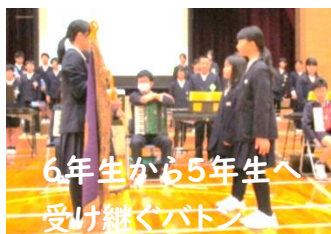
6年生から5年生へ 受け継ぐバトン