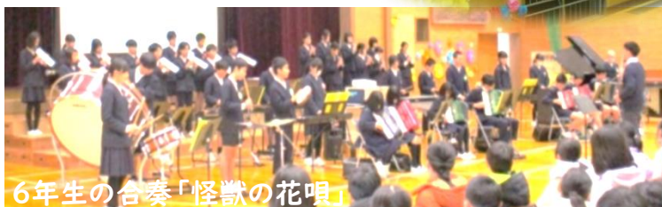
6年生の合奏「怪獣の花唄」