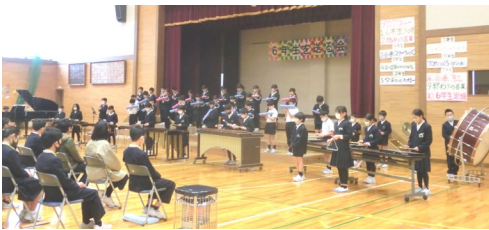
4年生：合奏「スターウオーズ」「紅蓮華」

5年生のみなさんのおかげで、みんながとてもあたたかい気持ちになり、笑顔になりました。