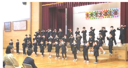
3年生：合唱「いつでもSmileしようね」

「6年生のみなさん、いつまでも笑顔のままでいてください。今までありがとうございました。心をこめて歌うので、きいてください。」