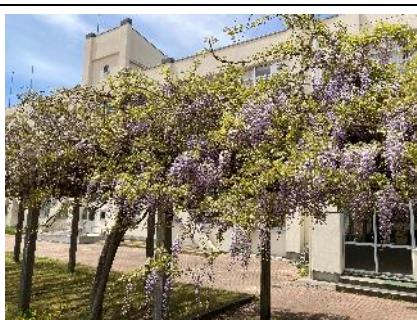
【校庭の藤棚 見頃です！】