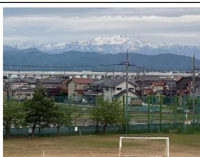
【教室の窓から白山の勇姿が！】