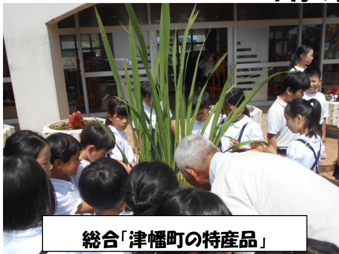
総合「津幡町の特産品」

総合では、調べたことを自分達でまとめ、発表しました。また、調べたことを深めるために、JAの方やまこもの生産組合の方をお招きし、まこもの育て方等について教えていただきました。