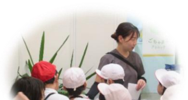
2年生 町探検 (ごちゃまるクリニックさんと)