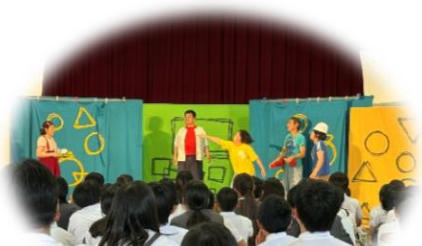
5・6年生 スクールシアター (劇団仲間の皆さんと)