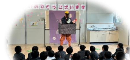
1年生 人形劇 (人形芝居燕屋さんと)