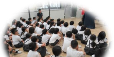
2・4年生 紙芝居 (のまりんさんと)