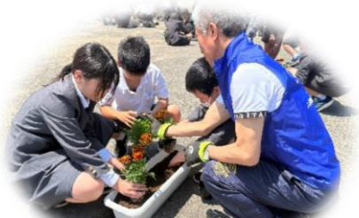
6年生 人権の花植え (人権擁護委員の皆さんと)

6小学校で学ぶ「輪島っ子」のために、たくさんの方々から様々なご支援をいただいています。たくさんの体験を通して、「輪島っ子」が健やかに成長してほしいという皆さんの思いに感謝の気持ちをもって、日々の学校生活を送ってほしいと思います。