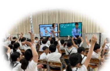
3・4・5年生 ピュアキッズスクール (輪島警察署の皆さんと)