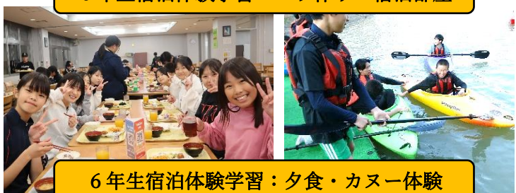
6年生宿泊体験学習：夕食・カヌー体験

前々回の学校だより(7号)においても紹介しましたが、輪島っ子の知的好奇心がはたらく「学ぶ楽しさ」が味わえる授業づくり、学び続けることの大切さを感じる授業づくりを輪島っ子とともに目指しています。