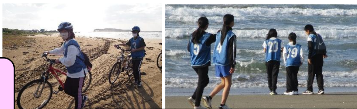
6年生宿泊体験学習：サイクリング