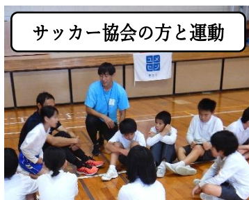
サッカー協会の方と運動