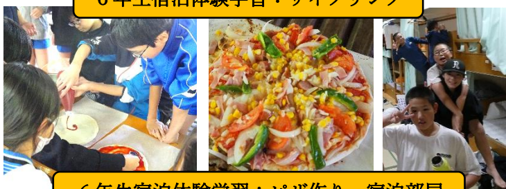
6年生宿泊体験学習：ピザ作り・宿泊部屋