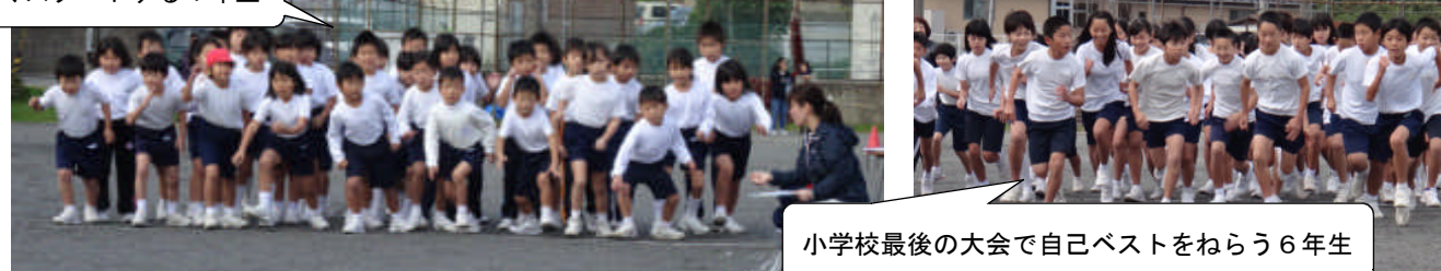
小学校最後の大会で自己ベストをねらう6年生