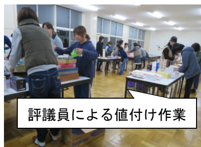
評議員による値付け作業