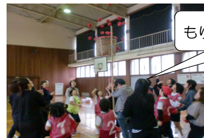
もりあがった「親子玉入れ」

ぼくが親子ほのぼの運動会で一番楽しかったことは、しょうがいぶつ競争です。わけは、へいきん台をわたったりなわとびをこうたいで10回ずつとんだりしてとっても楽しかったです。