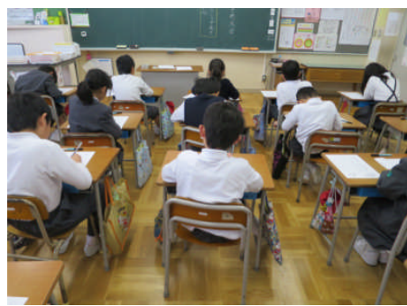
2年生「元気にあいさつ」