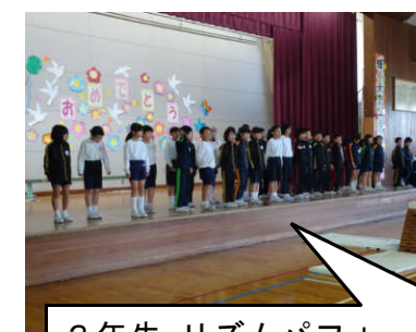
3年生 リズムパフォーマンス 「にんじゃへの道」