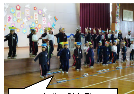
1年生 劇と歌 「ともだちっていいな」

多くの保護者と地域の皆様にご参観いただき、あたたかい拍手を頂戴しました。本当にありがとうございました。どの学年も、お世話になった6年生への「感謝の気持ち」を全力で表現しました。