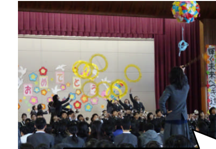
4、5年生 金管鼓隊 「校歌」・「栄光の架橋」