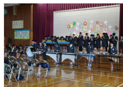
6年生 劇と合奏 「6年生からのプレゼント」