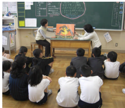
3年生への読み聞かせ

学校では、1年間で、「低学年1人平均90冊以上」「高学年1人平均50冊以上」という目標を設定し、様々な取組を行いました。3月は朝読書に、ボランティアの方々による「読み聞かせ読書」に取り組んでいます。