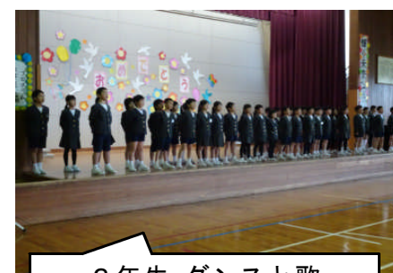
2年生 ダンスと歌 「鳳至タラレバ娘」