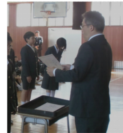
4/10 児童会任命式 6年生頑張ってます！