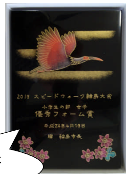
優秀フォーム賞に贈られた輪島塗りの楯

★優秀フォーム賞 【男子】 2名 【女子】 2名 ※ たくさんのご声援、ありがとうございました。