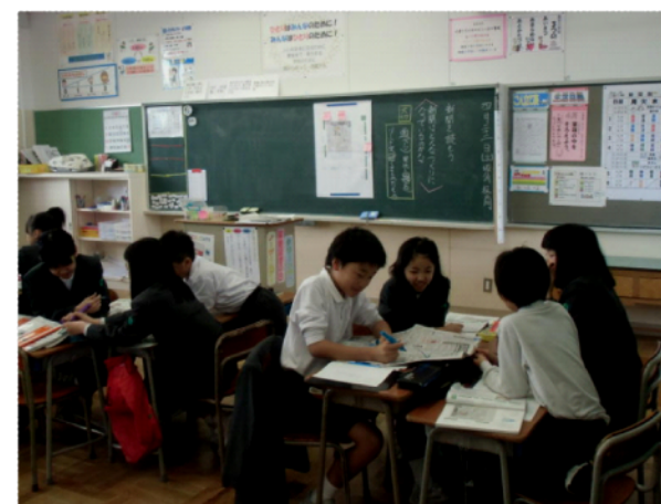
土曜授業② (話す 聴く活動)