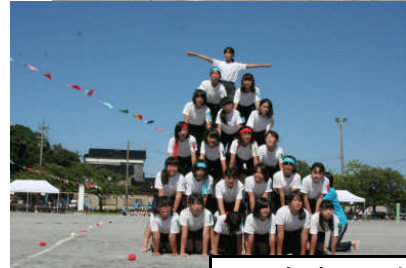
5,6年生のスタンプ「つなぐ」