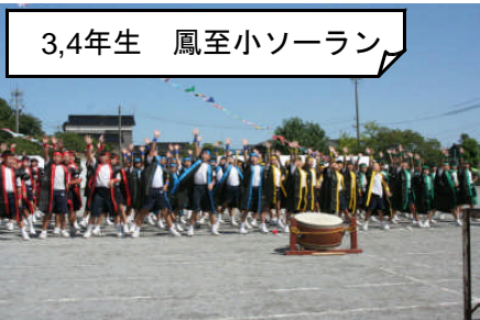
3,4年生 鳳至小ソーラン