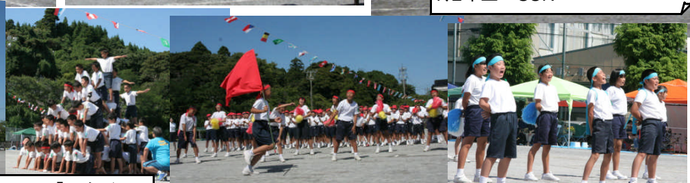
力のこもった応援合戦